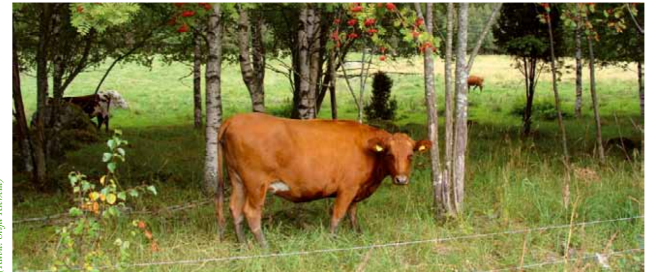
Suomenkarijaa perinnemaisemaa hoitamassa.

Lempäälä on “lähellä, mutta kaukana”. Lempäälässä yhdistyvät maaseutumaisuus ja ison kaupungin läheisyys ja lähellä olevat palvelut. Kunta on tunnistanut maaseudun vahvuudekseen ja pyrkii luomaan nauhataajaman reuna-alueista kaupungin ja maaseudun rajapintaa, jossa maaseutu on fyysisesti ja maisemassa läsnä. Tontit ovat isoja ja rajoittuvat joltain sivultaan peltoon tai metsään, jolloin luontoyhteys ja maaseudun tuntu säilyy. Maaseutumaisuutensa ansiosta Lempäälä erottuu selvästi Tampereen reuna-alueista, ja vetää edelleen uusia asukkaita puoleensa. Maaseutualueet otetaan päätöksenteossa ja resurssien ohjautumisessa huomioon tasapuolisesti kaupunkialueiden kanssa.