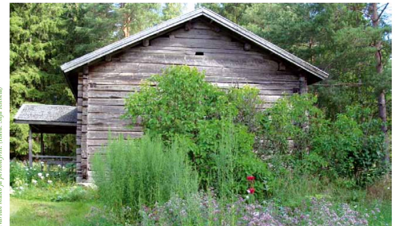
Narvan museo ja perinneperint.

Toimivat tietoliikenneyhteydet ovat välttämättömyys yrittäjille ja usein osallistumisen ehto myös asukkaille. Yhteyksien mahdollistaminen vähentää asuinpaikasta johtuvaa eriarvoistumista ja tuo turvallisuutta. Tulevaisuudessa ”Mummo-ohjelmat” mahdollistavat myös vanhuksien teknologian hyödyntämisen ja asioinnin helpottamisen. Vesilahdessa laajakaistahanke tuo toteutuessaankäytännössä koko kunnan asukkaille yhteydet. Lempäälässä on yksittäisillä hankkeilla edistettävä yhteyksien syntymistä.