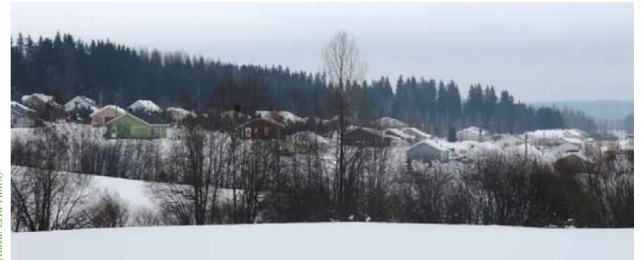
Modernin ja perinteisen maaseudun rajapintaa.

Vaikka kunnat ovatkin hyvin erilaiset niin asukasmäärän kuin keskustojensa osalta, erot häviävät kylätasolle mentäessä. Kylät yli kuntarajojen kohtaavat yhtenevät haasteet liittyen maantieteelliseen sijaintiin ja sen myötä kasvuun, palvelujen tarjontaan ja maaseutumaisuuden säilyttämiseen. Alueen ongelmaksi saattaa muodostua osittain liian nopea ja hallitsematon kasvu, josta pahimmillaan seuraa maaseutumaisuuden sekä veto- ja pitovoimatekijöiden menettäminen. Rakentamisen paineet ja kylien kasvaminen vaikuttavat myös maaseutuyrittäjyyteen ja maatalouden toimintaedellytyksiin.