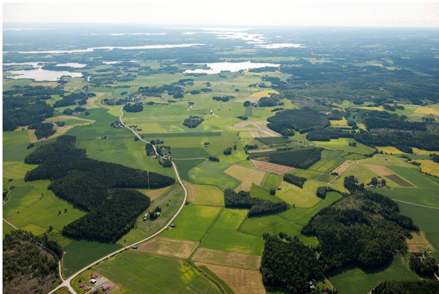
Viistokuva Kehrontien ja Koskenkyläntien risteyksen yltä kohti Koskenkylän taajamaa